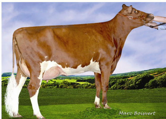
LAROC OBLIQUE FANIE FIFTH DAM